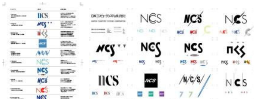
・VIデザイン11案 (左) ・上記デザイン展開案 (上)