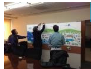
パネルパーティション