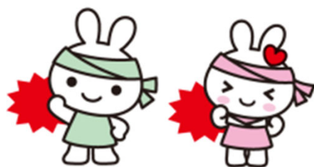
がんばるポーズ アレンジ