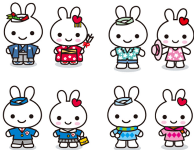
春・夏・秋・冬 アレンジ