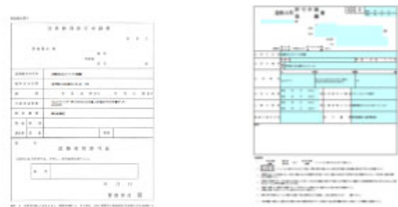
道路占用許可・道路使用許可申請書