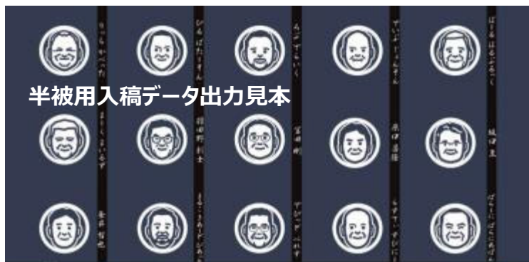
半被用入稿データ出力見本