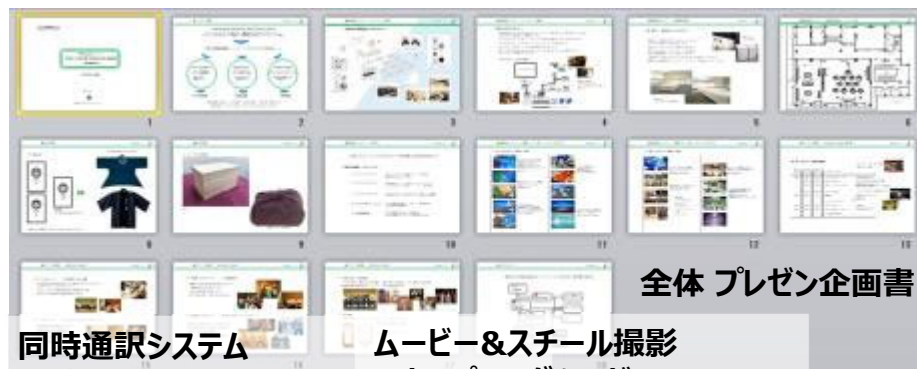
全体 プレゼン企画書