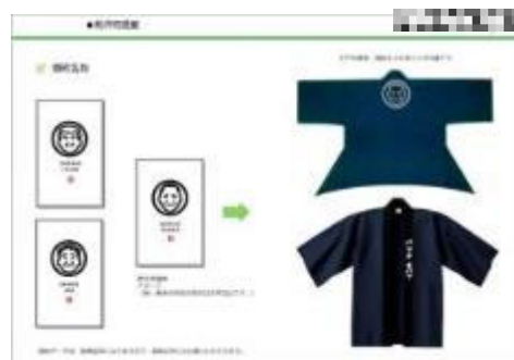
プレゼン企画書 顔紋提案ページ