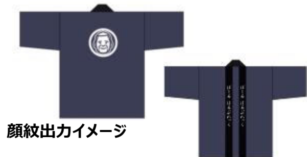
顔紋出カイメージ